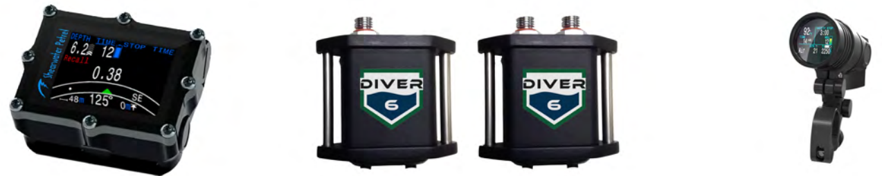
Shearwater Petrel personalizada para el Diver6 Sensor de Presión Shearwater Sencillo ó Doble Shearwater NERD Personalizado para el Diver6

Los productos Shearwater realzan Diver6 al proveer información vital adicional (presión del tanque y cómputos de buceo) así como información de navegación para asistir y enviar buzos a locaciones.